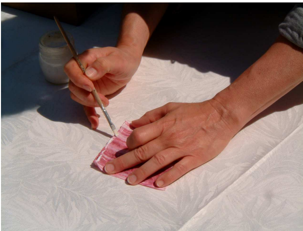
Foto 2 e 3: mettete della colla sull'orlo del lato corto e ripiegate il lembo all'ingiù incollandolo come se aveste fatto una cucitura. Fate la stessa cosa dall'altra parte.

Foto 1: aprite completamente i 20 cm di filo macro e distribuite colla lungo i lati lunghi lasciando senza colla le due estremità per circa 4 cm. Poi piegate e incollate i “bordi” del sacchetto.