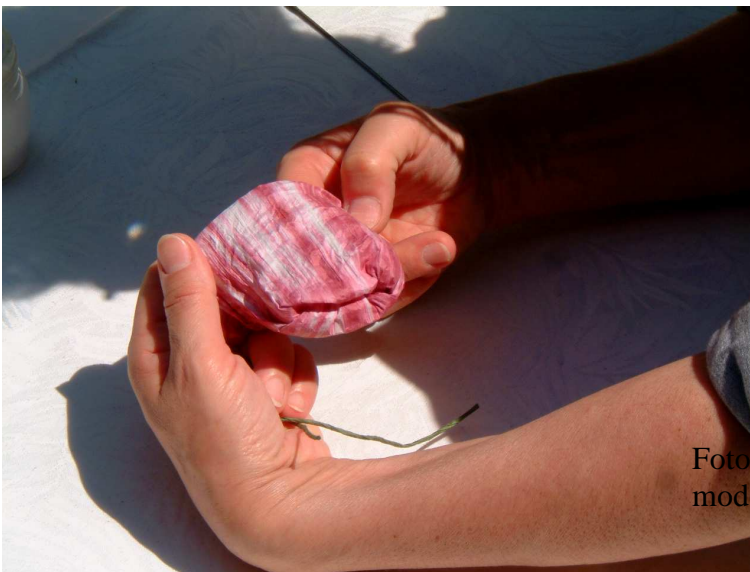
Foto 6 e 7: ora risvoltate il sacchettino in modo da lasciare le “cuciture” all’interno