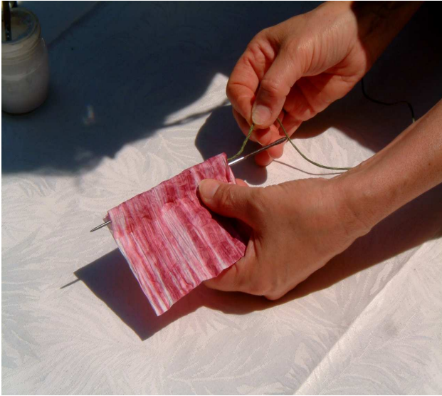
Foto 4: aiutandovi con un ferro da calza, infilate un pezzo di filo sottile verde di 40 cm. Nei passanti che avete creato prima in modo che le due estremità fuoriescano dallo stesso lato.