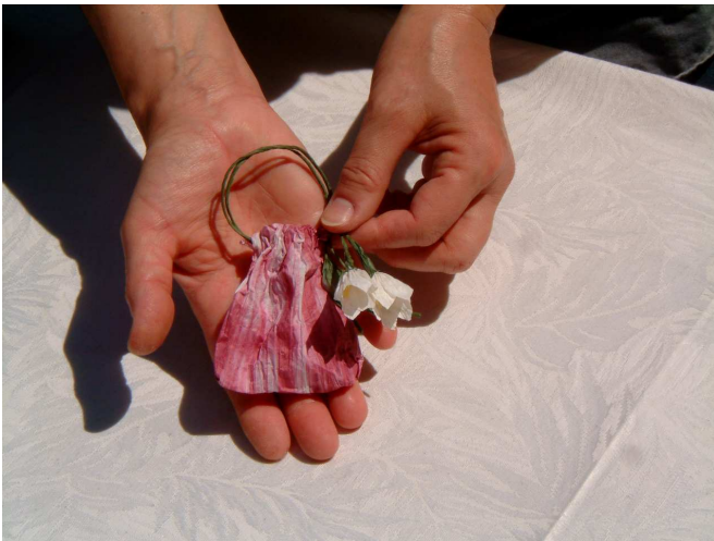
Foto 12: aprite a fogliolina le altre due estremità e la borsina è pronta.