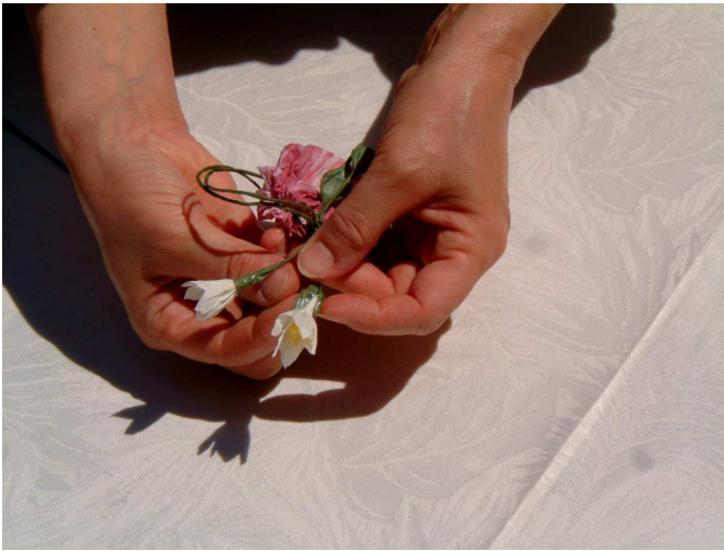
Foto 11: posizionate la campanella già preparata ed incollate il filo verde su sé stesso per formare il calice del fiorellino