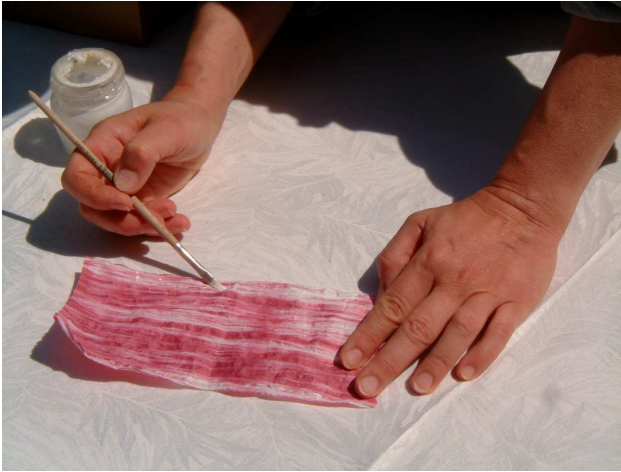
Foto 1: aprite completamente i 20 cm di filo macro e distribuite colla lungo i lati lunghi lasciando senza colla le due estremità per circa 4 cm. Poi piegate e incollate i “bordi” del sacchetto.