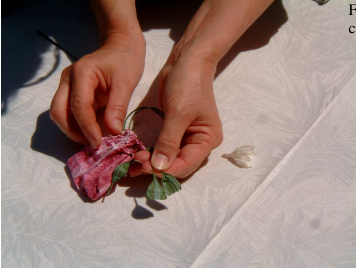
Foto 10: aprite le estremità di due dei quattro capi per circa 1 cm. E metteteci un po' di colla