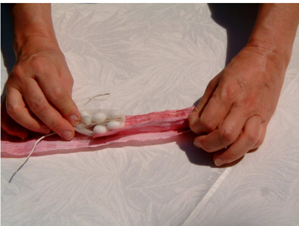
Foto c: aprite completamente il filo macro e tagliatelo per il lungo a metà, vbi servirà per 2 bomboniere. Posizionate il sacchettino di tulle circa al centro e ripiegateci sotto un'estremità del filo macro.

Foto b: piegate in due il tubino ottenuto e stringete con un nodo un pezzetto di filo sottile bianco di 20 cm. Per chiudere il sacchettino