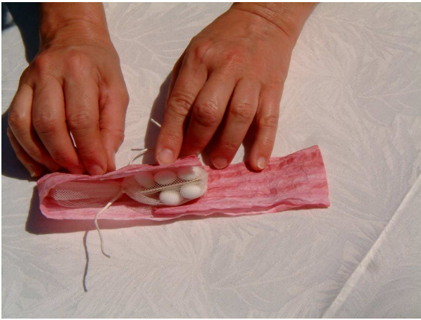
Foto d: piegate l'altra estremità di filo macro sopra al sacchettino di tulle