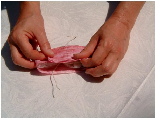
Foto e: piegate nuovamente la parte in basso del filo macro in modo che l'estremità superiore di questa risulti posizionata a 2/3 circa dell'altezza totale della bomboniera