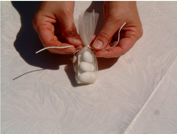
Foto b: piegate in due il tubino ottenuto e stringete con un nodo un pezzetto di filo sottile bianco di 20 cm. Per chiudere il sacchettino

Foto a: disponete al centro del tulle i confetti e il bigliettino e arrotolate il tutto per il lungo