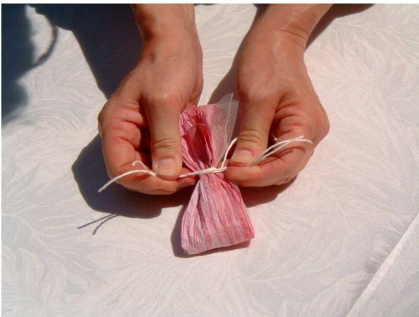
Foto f: stringete il tutto facendo un nodo semplice con due pezzi di filo sottile di 20 cm l'uno.