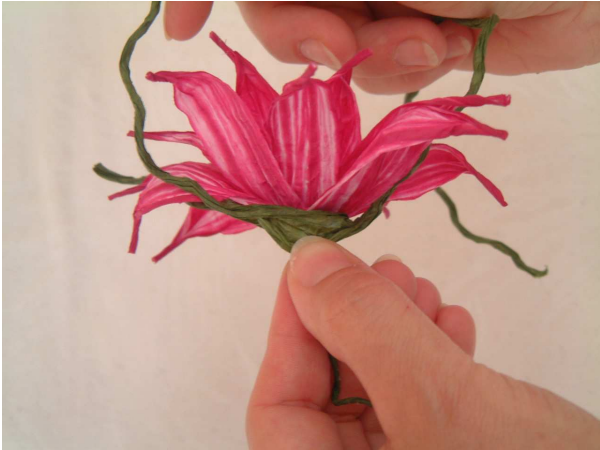
Foto 10 Incollate la parte di filo vite aperta alla base del calice del fiore.