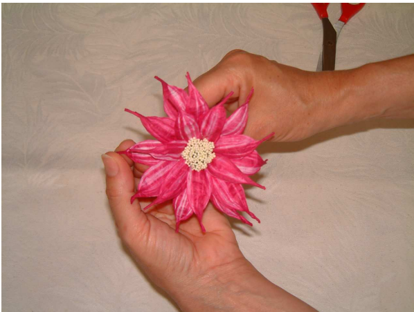
Foto 8 Incollate tutti i petali lunghi 7,5 cm a raggiera posizionandoli fra un petalo e l'altro del giro precedente.