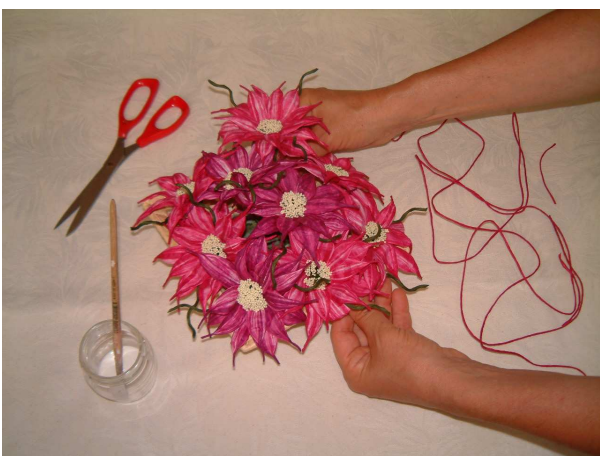
Foto 15 Disponetelo ora a vostro piacere insieme ad altri fiori, magari di una tonalità più scura, in un cestino o altro contenitore.