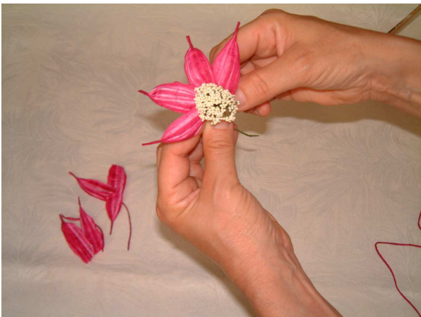
Foto 5 Proseguite allo stesso modo incollando a raggiera tutti i sette petali lunghi 6,5 cm. Sovrapponendoli un poco uno all'altro.