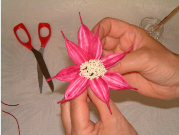
Foto 7 Posizionate il petalo fra altri due del giro precedente e incollatelo stringendolo alla base.