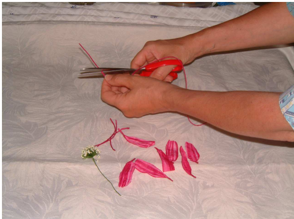
Foto 1 Tagliate 7 pezzi di filo sottile rosa fucsia lunghi 6,5 cm e 7 pezzi di filo sottile rosa fucsia 19 lunghi 7,5 cm.