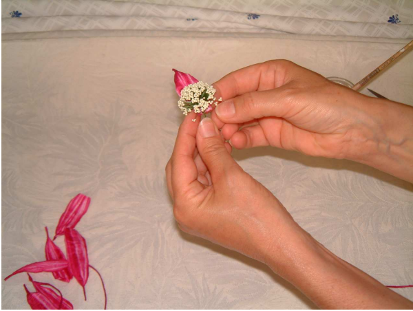
Foto 4 Incollate il petalo, stringendolo alla base, sullo stelo del pistillo nebbia avorio , proprio sotto alla corolla.