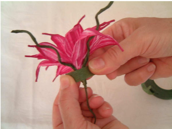
Foto 11 Tirate un'estremità di guttaperca verde e posizionate la alla base del calice del fiore