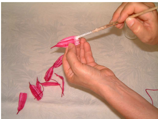
Foto 3 Mettete un po' di colla vinilica alla base di un petalo di 6,5 cm.