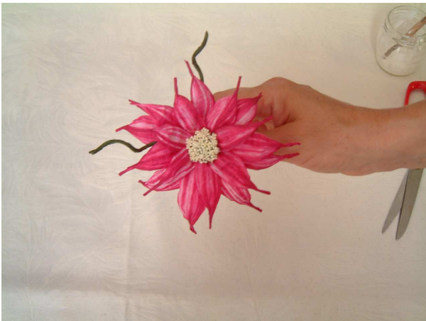
Foto 14 Il vostro fiore è completo.