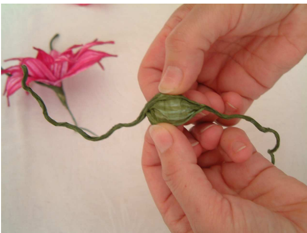
Foto 9 Aprite al centro un pezzetto di filo vite bicolore verde medio lungo circa 20 cm.