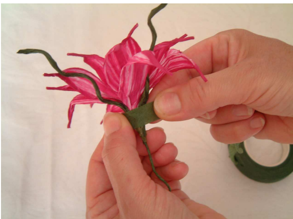
Foto 12 Avvolgete la guttaperca per un paio di giri intorno alla base del fiore, sempre tirandola in orizzontale per farla appiccicare su se stessa e fissarla così al gambo.