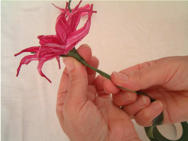
Foto 13 Disponete ora la guttaperca in diagonale ed avvolgete tutto lo stelo, sempre tirandola per renderla appiccicosa.